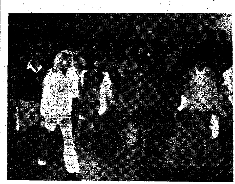
מחבלים משתורעים מכלא ידדני, בעקבות תגובה שטוריו המלך חוסיין

סיגריה העילית מטבק מזרחי מעולה בקופסת הזהב